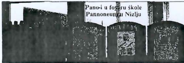
Pano-i u foyeru škole Pannoneum u Nizlju

Hatsko kolo je nastupilo s najmladjimi člani pri projektu »Dobro došli Hrvati«. U turistiĉkoj školi se je predstavila i čuvarnica iz Pandrofa. (ur.)